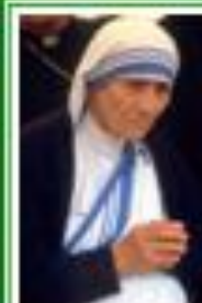
Mutter Teresa von Kalkutta