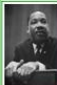
Dr. Martin Luther King