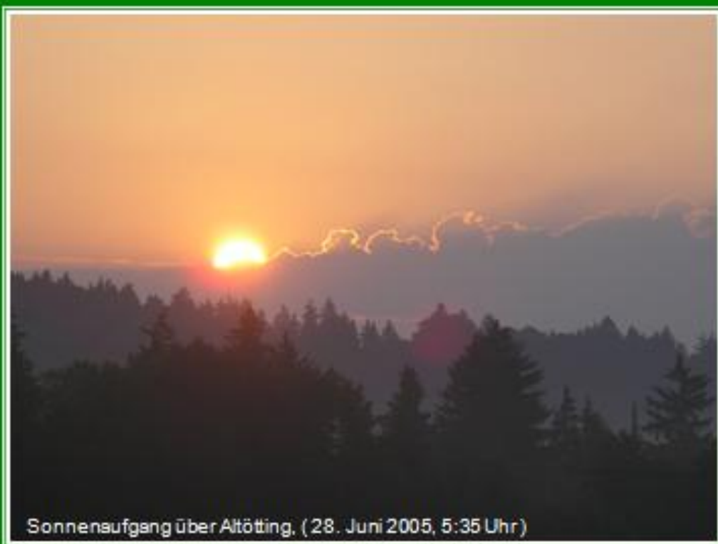
Sonnenaufgang über Altötting. (28. Juni 2005, 5:35 Uhr)