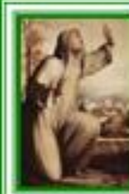
Katharina von Siena